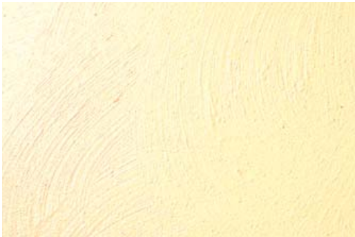
Nr. 307 (feine Körnung), abgetönt mit AURO Vollton- und Abtönfarbe Nr. 330-10 (ocker gelb), mit dem Flächenstreicher gestrichen (Halbkreise kreuz und quer, mit Schwung) Farbabweichungen durch Druckversion möglich!