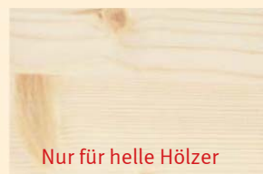
Nur für helle Hölzer