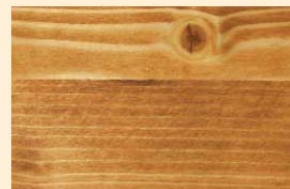
Teaköl Nr. 102-81