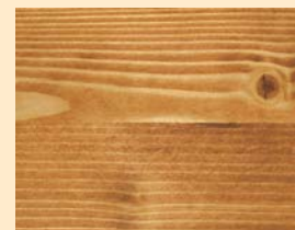
Teak Nr. 110-81