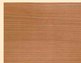
Lärche Nr. 110-89