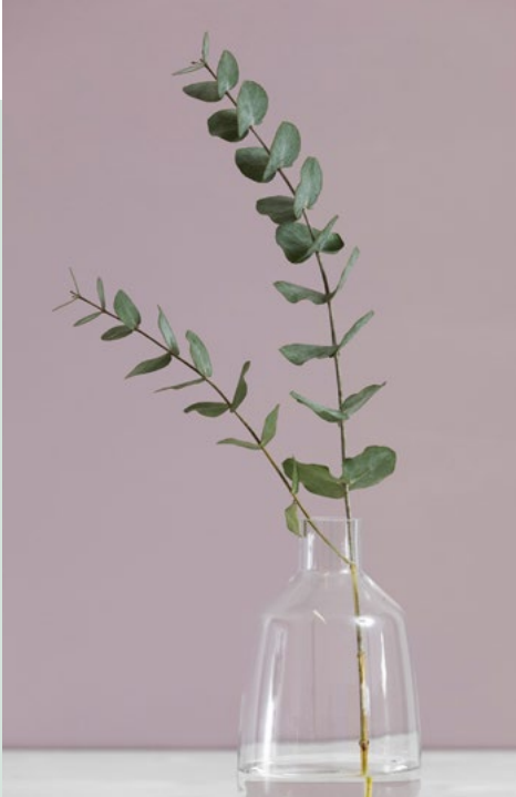
oriental night 15

Mit Grün verbinden wir Natur und Leben. Um Grüntöne besser wirken zu lassen, empfiehlt sich eine Kombination mit Rosa, Orangerot oder Senfgelb. Durch solche Kontraste wirken Räume warm und einladend.