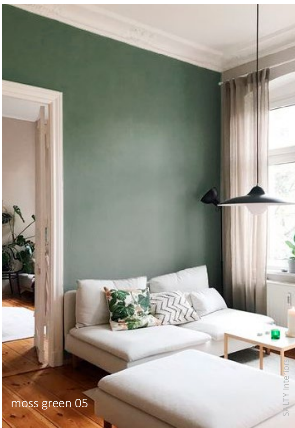
moss green 05

Die Verbindung aus Leistung und Nachhaltigkeit macht die Produkte so besonders. Sie punkten mit einer neuen ökologischen Rezeptur in höchster Qualitätsstufe.