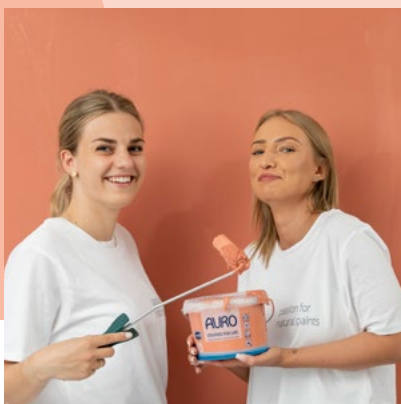
indian summer 15

Es ist das Spiel mit den Farben, die Räume so einzigartig machen. Erdtöne, Rotnuancen und zarte Sandfarben, sehr gut kombinierbar mit Weiß oder verschiedenen Graustufen, zaubern ein modernes und gleichzeitig natürliches Wohnambiente.