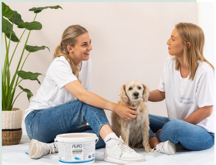
havana cigar 20

Durch besonders hochwertige, rein mineralische Pigmente erreichen die Farbtöne der COLOURS FOR LIFE-Linie eine ausgesprochene Wirkungstiefe, sind dabei langlebig und natürlich konsequent ökologisch.