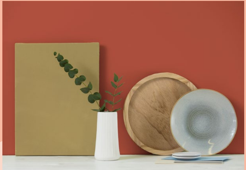
terra cotta tone