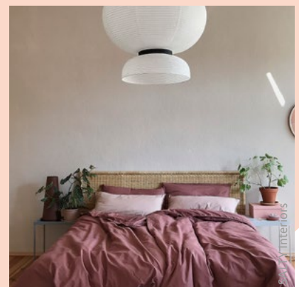
beige brown 20