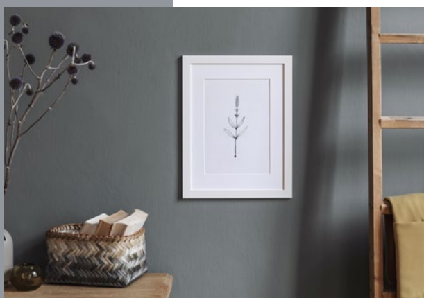
mystic grey 10