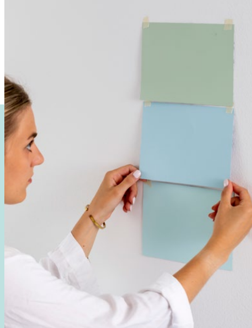
v. o. n. u.: 813 light teal, pacific ocean 20, teal 25

Blaugrün schafft ein wohnliches, zeitloses Ambiente, die Töne lassen sich am besten mit warmen Materialien wie zum Beispiel Holz ergänzen. Wie zu jeder Farbe passen neutrale Nuancen auch sehr gut zu Blaugrün. Wohnaccessoires von Aquamarin bis Petrol unterstreichen nicht nur die Individualität, sondern verleihen dem Raum Lebendigkeit.