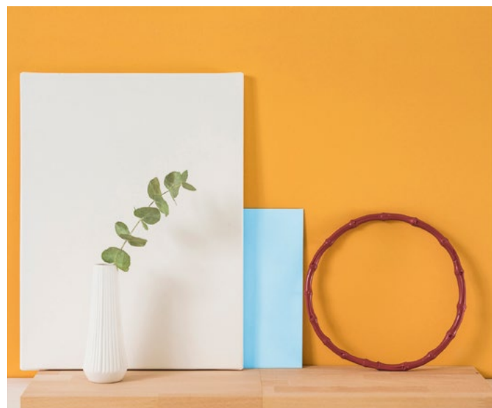
v. l. n. r.: yellow gold 05, subtle touch, apple green 05, pacific ocean 20, bright chestnut 05

Alle 96 Farbtöne der Designer's Collection finden Sie auf der Themenseite.