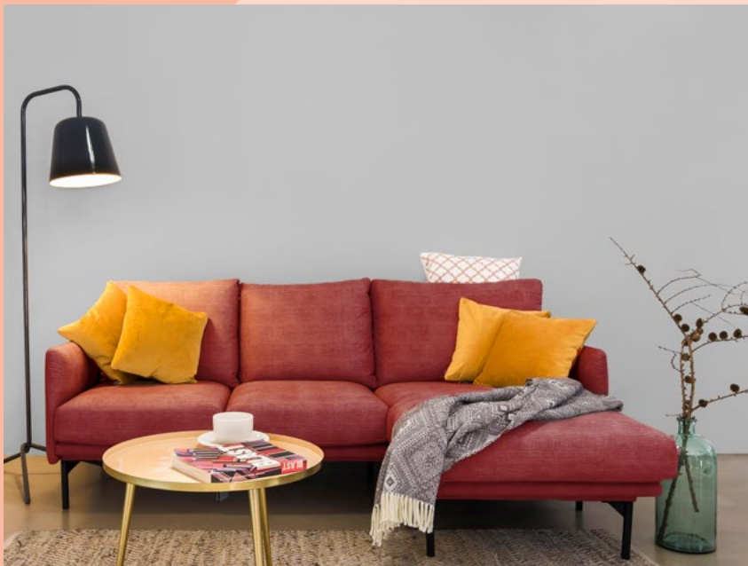
plum grey 20

Es ist das Spiel mit den Farben, die Räume so einzigartig machen. Erdtöne, Rotnuancen und zarte Sandfarben, sehr gut kombinierbar mit Weiß oder verschiedenen Graustufen, zaubern ein modernes und gleichzeitig natürliches Wohnambiente.