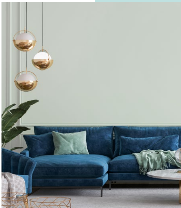
133 turnip cabbage